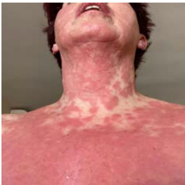
Figura 1. Exantema maculopapular en el rostro y el tronco.

Paciente femenina de 60 años, que acudió al servicio de Urgencias por un cuadro de exantema eritematoso, levemente pruriginoso, de una semana de evolución, que afectaba el tronco, la cara y las palmas de las manos ( Figura 1 ); sin fiebre ni dolor faríngeo asociado. El examen físico reportó: máculas eritemato-violáceas confluentes, algunas en “diana”, con signo de Nikolsky negativo. No se evidenciaron: angioedema, adenopatías, ni afectación de las mucosas. La paciente refirió haber consumido meloxicam en los últimos tres días, e hidroxyclorequina (200 mg) tres semanas por ante-