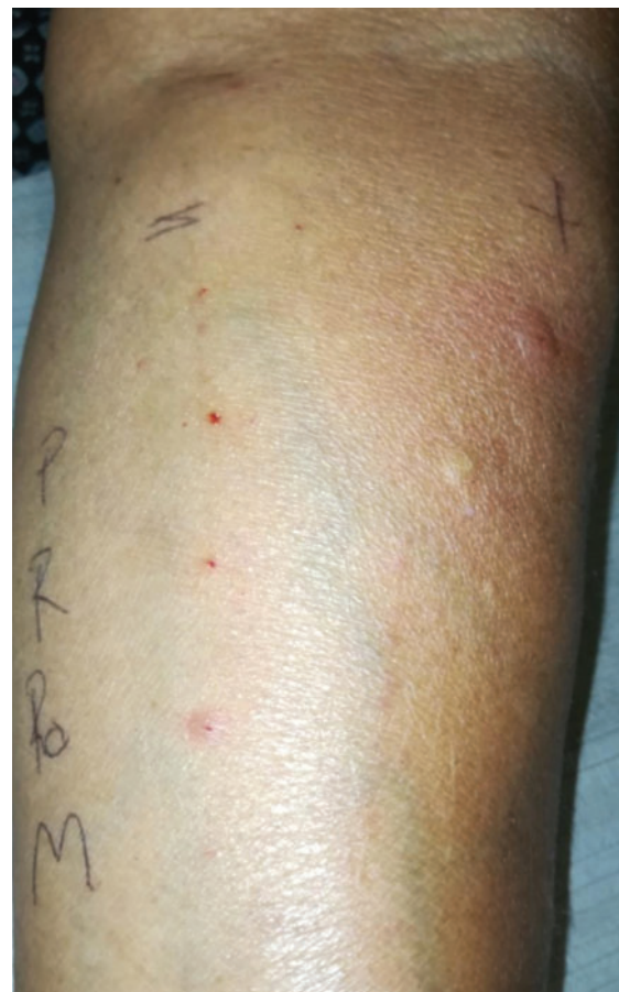
Figura 2. Punción cutánea + histamina (control positivo), solución salina (control negativo), P = propofol, M = midazolam, RO = rocuronio, R = rupivacaína.

En el periodo de estudio se registraron 32 casos de alergia perioperatoria; fueron eliminados dos pacientes por no aceptar los procedimientos de pruebas cutáneas y dos al no acudir a la realización de las