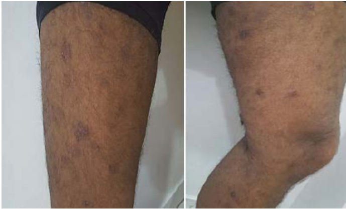
Figura 1. Lesiones iniciales que presentó el paciente en miembros inferiores, con formato numular, hipercrómicas, algunas con leve descamación.

2500 UI/mL, velocidad de sedimentación de 6 mm/hora, proteína C reactiva de 0.22, pruebas negativas VDRL, FTA-ABS y serologías para HTLV-1 y VIH. Fueron realizadas dos biopsias de piel con las que se evidenció dermatitis perivascular espongiótica (figura 3). La investigación sérica de IgE específica indicó sensibilización para aeroalérgenos: Dermatophagoides pteronyssinus , Blomia tropicalis , pelo de perro y de gato.