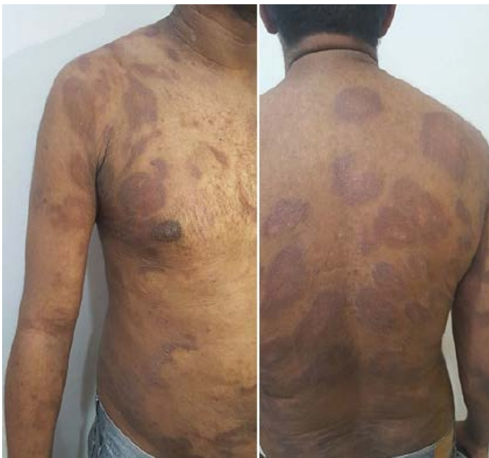
Figura 2. Lesiones policíclicas, la mayoría con formato anular, bordes infiltrados, eritematovioláceas, en dorso anterior y posterior, abdomen y miembros superiores. Con más infiltración y descamación.

Inicialmente presentó mejoría con posterior recaída clínica con cuadro de eritrodermia exfoliativa, por lo que requirió recurrentemente prednisona (0.5 mg/kg/día). Como no respondió a 25 mg/sema-