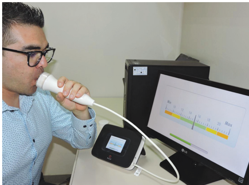
Figura 2. Maniobra de FeNO: el paciente genera una exhalación lenta y sostenida durante 10 segundos por el sensor del aparato que mide la fracción exhalada de óxido nítrico. La pantalla del aparato muestra una animación que incita al paciente a exhalar durante el tiempo necesario para la medición

Justificación: Las mediciones de la FeNO se compararon directamente con otros procedimientos diagnósticos para el asma, como los eosinófilos en el esputo inducido, la espirometría y las pruebas de reto bronquial. En niños la FeNO \geq 19 ppb tiene sensibilidad y especificidad elevadas, y mostró una buena correlación con los eosinófilos en el esputo inducido 25 y con las pruebas de reto bronquial. 57 En un metaanálisis comparativo de una variedad de pruebas para el diagnóstico del asma (espirometría, pruebas de reto bronquial, y/o pruebas de reversibilidad, FeNO) se valoró de forma positiva la medición de la FeNO. Los autores incluso se cuestionaron si la FeNO podría hacer que fueran superfluas las pruebas de broncoprovocación. 58 Por otro lado, la medición de la FeNO demostró ser semejante al recuento de Eos como un indicador de la cuenta de eosinófilos en el esputo inducido. 11 Además, la FeNO está disponible para su uso en la cama del paciente, facilitando al personal clínico la toma de decisiones. 11 La técnica online se utiliza en niños de edad escolar y la offline en preescolares 59 (figura 2).